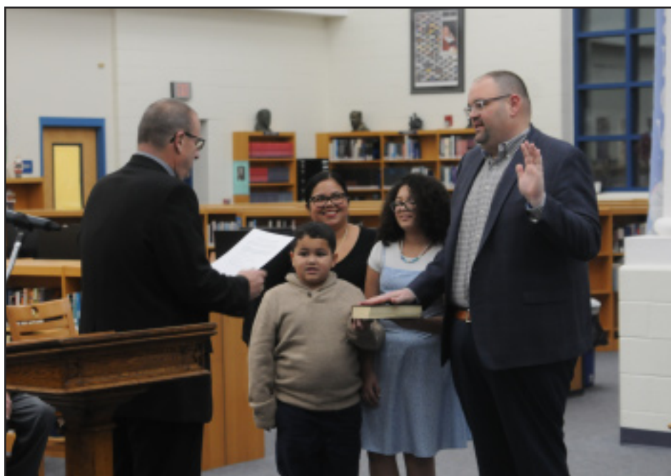
To purchase photos in The Gazette, call (609) 704-1940.

Este informe se compone de las detenciones e investigaciones realizadas por los hombres y mujeres de la aplicación local. Todos los sospechosos y detenidos son inocentes hasta que se demuestre su culpabilidad en un tribunal de justicia.