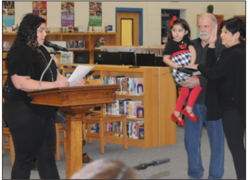
Para comprar fotos en The Gazette, llame al (609) 704-1940.

“Quiero dar las gracias a todos por seis