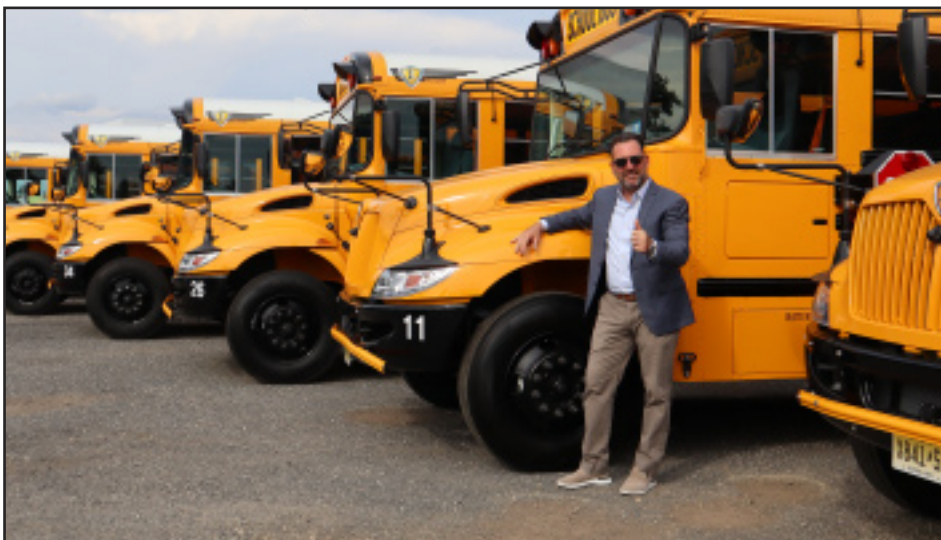
Para comprar fotos en The Gazette, llame al (609) 704-1940.

El distrito escolar planea implementar la nueva flota para el año escolar 2022-2023.