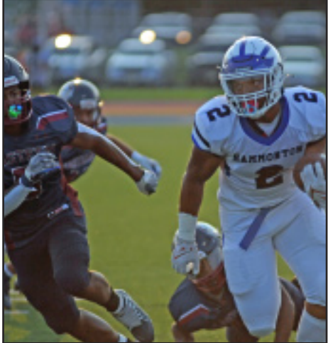
Para comprar fotos en The Gazette, llame al (609) 704-1940.