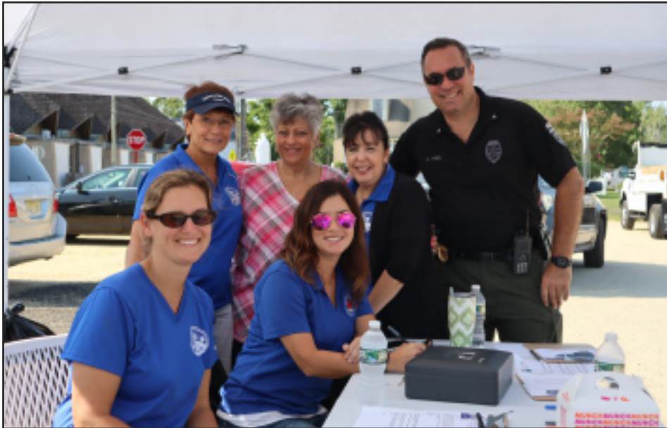
To purchase photos in The Gazette, call (609) 704-1940.