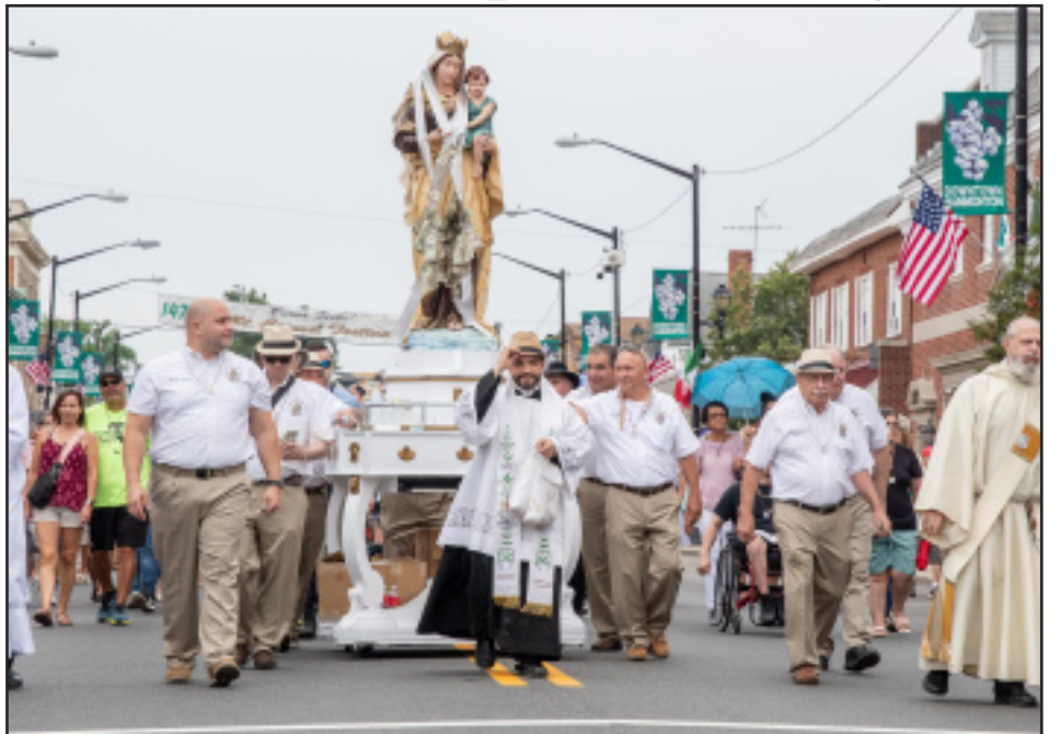
Para comprar fotos en The Gazette, llame al (609) 704-1940.

La estatua de Nuestra Señora del Monte Carmelo en la Avenida Bellevue el 16 de julio durante la Gran Procesión de los Santos.