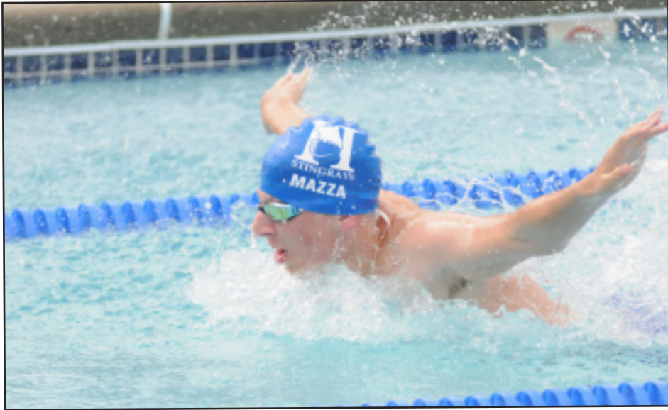
Para comprar fotos en The Gazette, llame al (609) 704-1940.