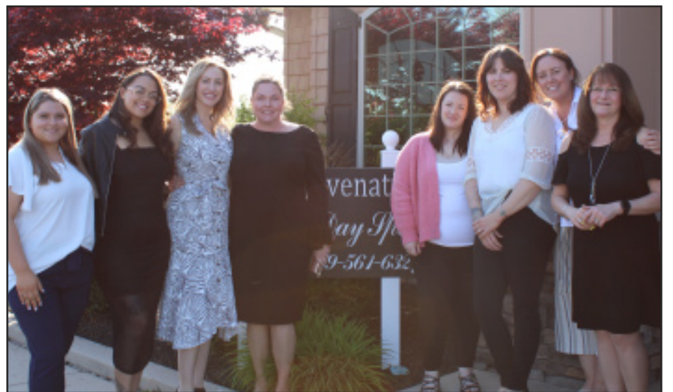
Para comprar fotos en The Gazette, llame al (609) 704-1940.