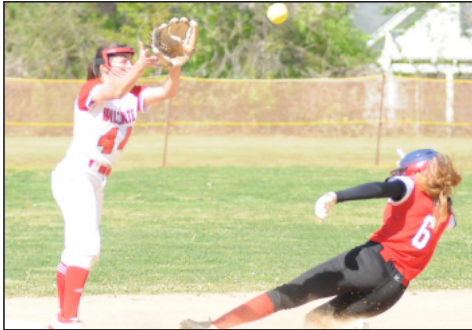
Para comprar fotos en The Gazette, llame al (609) 704-1940.